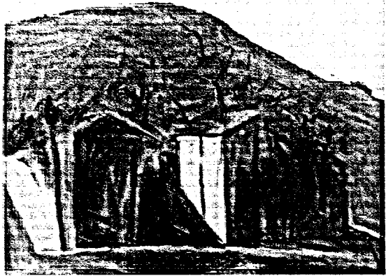
Paesaggio, 1943 olio su tela, 49 x 52 cm Bologna, collezione privata