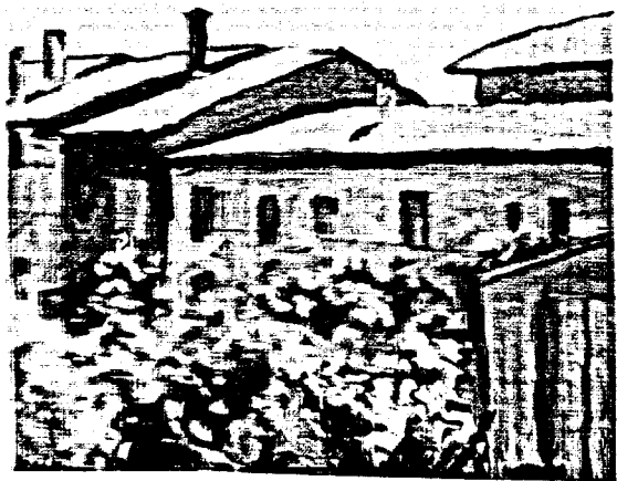
Paesaggio. Cortile di via Fondazza, 1954 olio su tela, 56 x 56 cm Bologna, Galleria Comunale d'Arte Moderna "Giorgio Morandi"