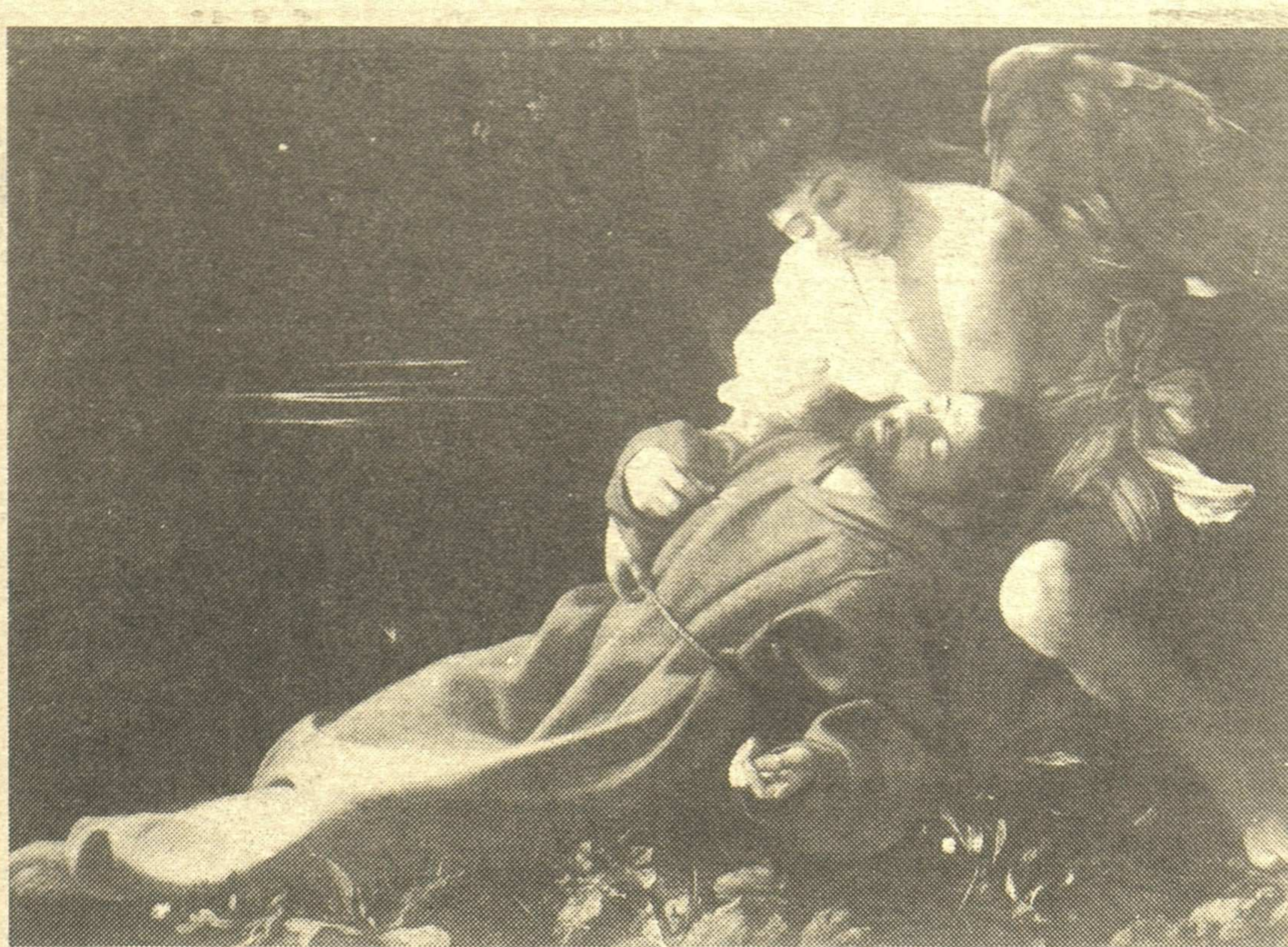
A fianco: Caravaggio: San Francesco che riceve le stigmate. Sotto: L'amor vincitore